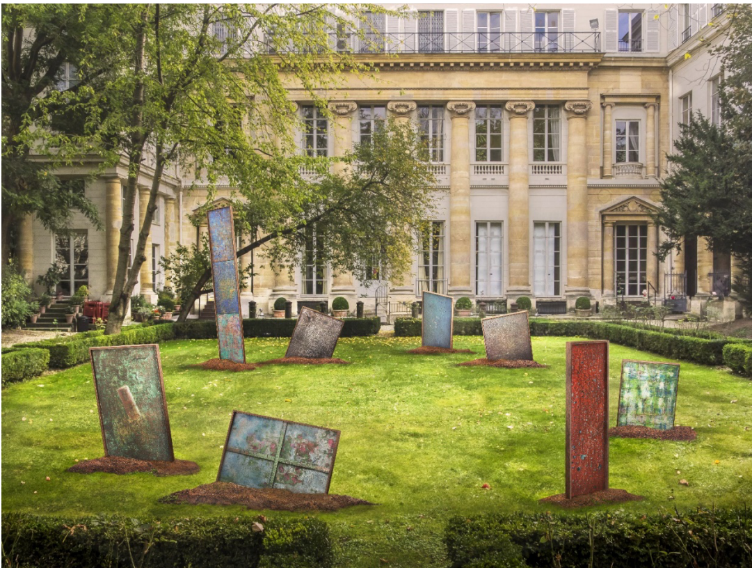
Installation ' Hôtel de Galliffet ' de Sergio Mario Illuminato (2024)